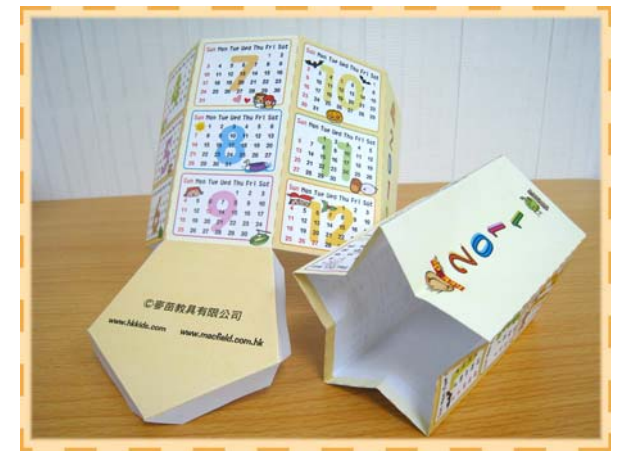
「搗蛋家庭」筆筒月曆